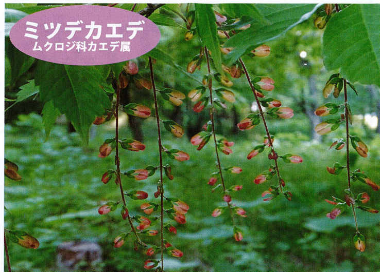
ミツデカエデ ムクロジ科カエデ属

県民の森で最も遅く開花するカエデ。葉の縁は2~3重になった粗い重鋸歯で、5裂する優美な葉が特徴。他のカエデは若い翼果が目立つ時季に、黄緑色の可憐な花をひっそりと咲かせます。