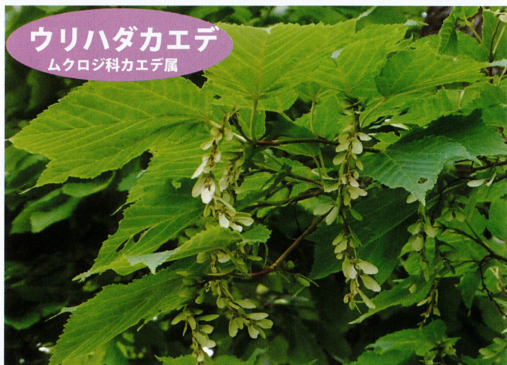
ウリハダカエデ ムクロジ科カエデ属

3つに裂けた葉が特徴のカエデ。若い翼果は赤みがかった房のように垂れ下がり、まるで「垂れかざし」のよう。新緑のなかで風に揺れる姿は涼やかな美しさを見せてくれます。