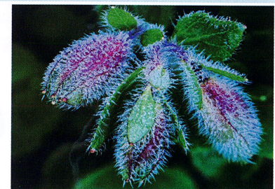
エゾツツジ 2024年 秋田駒ヶ岳

20歳の頃から登山に親しみ、現在も八幡平や岩手山などに年60回ほど通う山岳カメラマン。奥州市在住。80歳。