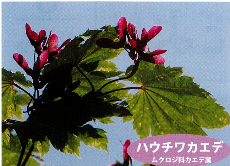
ハウチワカエデ ムクロジ科カエデ属

翼果（よくか）とは、風に乗って遠くに運ばれるための「羽根つきの実」のこと。カエデ類の実は2枚の翼を広げてプロペラのような形をしています。若い翼果は淡い紅色や黄緑色で透明感があり、新緑のなかで陽の光に透けたり、雨に濡れる姿はこの時期ならではの美しさです。秋に熟して、茶色に乾燥して軽くなると翼は2つに割れて1つずつ風に乗って旅立ってゆきます。