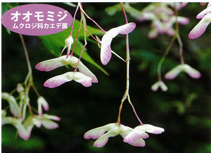
オオモミジ ムクロジ科カエデ属

「天狗の羽団扇（はうちわ）」のように大きく切れ込む葉が特徴で名の由来にもなっています。若い翼果は赤みを帯びて陽の光に透けるとひととき美しく新緑の中でとても目立ちます。