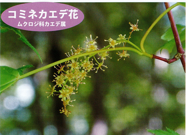
コミネカエデ花 ムクロジ科カエデ属

大きく切れ込む葉と鮮やかな秋の紅葉で有名です。翼果は左右に長く伸びて垂れ下がります。この時期はほんのりとピンク色に染まり、雨に濡れると輝いて、森のなかで浮き上がって見えてたいへん美しいです。