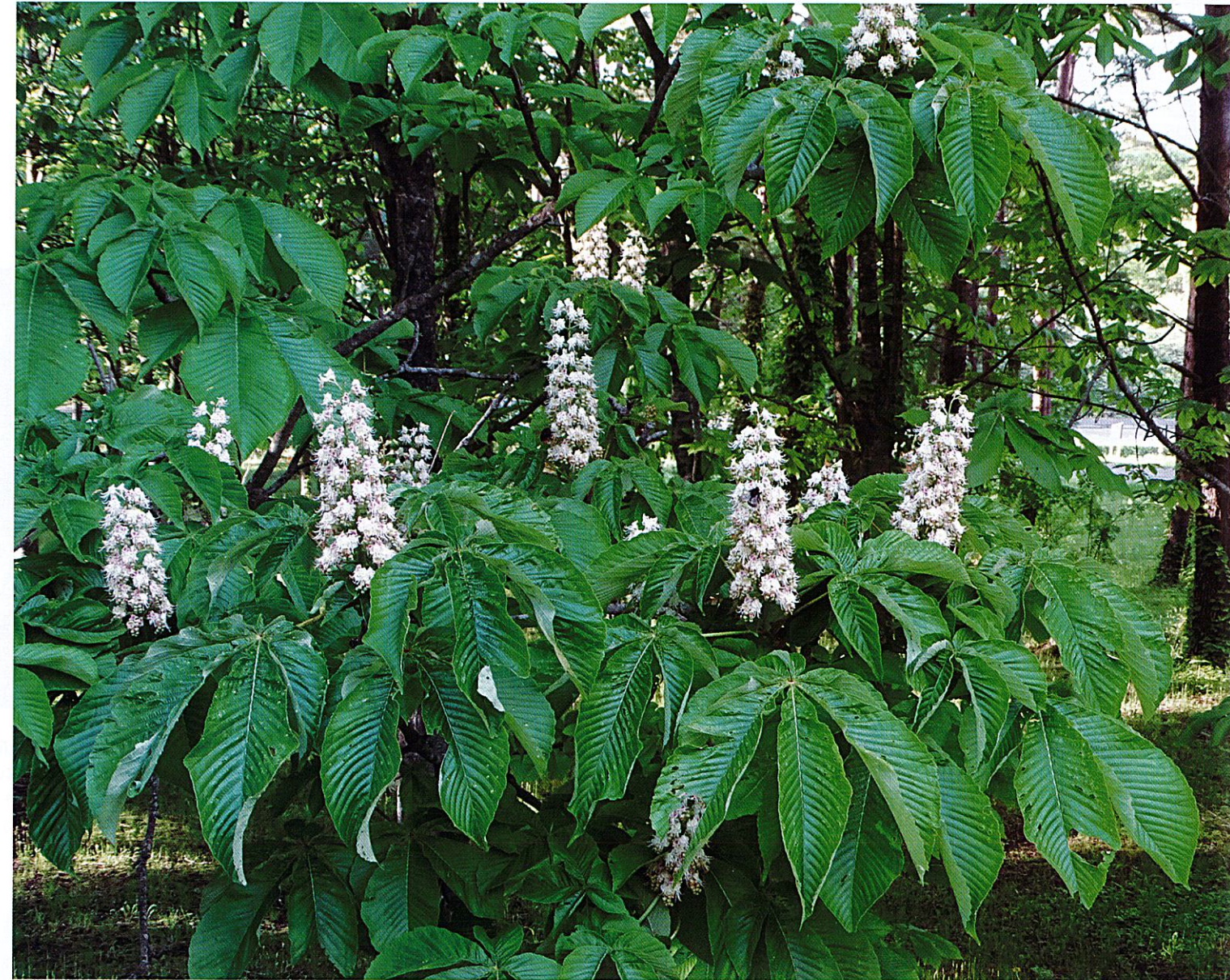
トチノキ (記念の森) 2025年5月28日

令和8年4月から、ネーミングライツにより、岩手県県民の森の愛称が「岩手県県民の森オヤマダエンジニアリング八幡平フォレスト」となりました。ネーミングライツとは、企業が施設の愛称を付ける権利を得る制度で、協力金は施設の維持管理などに活用されます。自然環境や、学習館などの施設の利用方法はこれまでと変わりません。引き続き皆様の憩いの場としてご利用ください。今後ともどうぞよろしくお願いいたします。