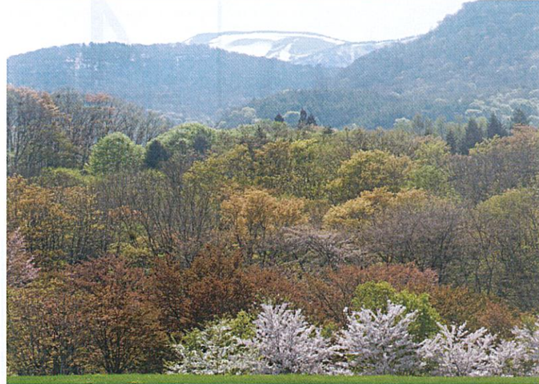
【春紅葉 「みんなの広場」から源太ヶ岳方面を望む】2025/5/13 岩手山や八幡平の残雪の稜線を背景に、北国の落葉広葉樹の森が淡い色合いに染まります。所々に植栽されている常緑針葉樹の深い緑がアクセントとなり美しい風景を見せてくれます。

木々が芽吹き。本格的な光合成がはじまり新緑になる前、生まれたての葉っぱは本来持つ色の赤や黄色のままで、まるで「秋の紅葉」のように見えます。ちなみに落葉前に葉っぱの緑色の色素（葉緑素）が分解されて黄色に見えたり、糖分が変化して赤い色素ができてくるのが「秋の紅葉」。「春紅葉」は、新緑になる前のほんの僅かな期間のみ見られる現象です。落葉広葉樹が多い北国ならではの春の美しい風物詩。ぜひ会いにいらしてください。