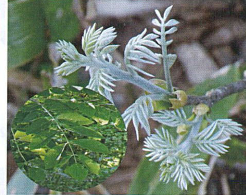
【イヌエンジュ芽吹き】2022/5/8 【左：新緑】2020/6/8

葉っぱのあかちゃんは産毛に覆われ、大切に守られている樹種も多いです。なかには全体がふかふかの産毛に包まれて銀色に輝いて見える芽吹きも。春の森のなかでひととき目立つ芽吹きです。