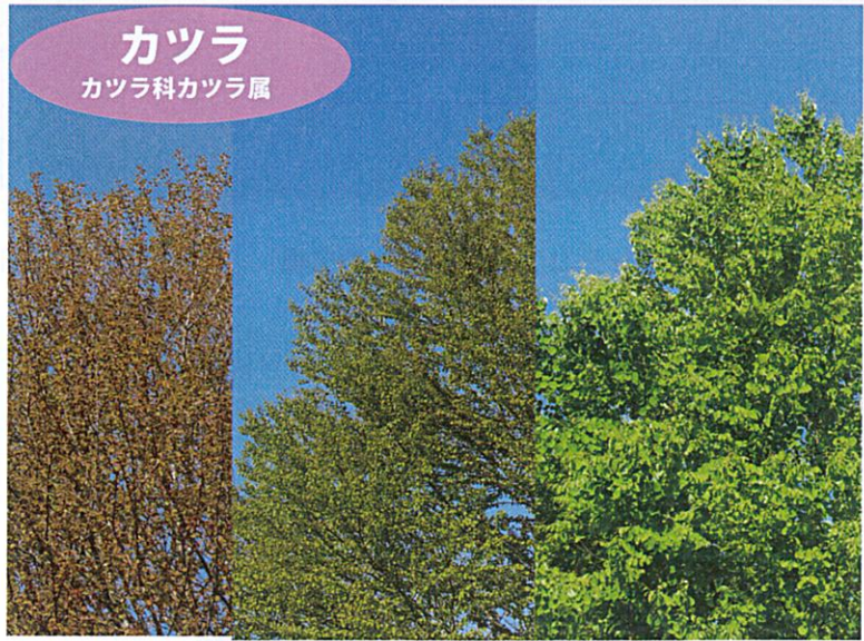
【左：葉っぱの芽吹き】2023/4/28 【中】2023/5/3 【右：新緑】2023/5/26 早春、カツラは葉っぱより先に花が咲き、花が終わるころ、葉っぱが芽吹きます。生まれたての葉っぱは、赤～薄赤色。だんだんと透明感のある緑へ、そして爽やかな新緑へと変化します。この時期は見るたびに異なる色合いに出会えます。