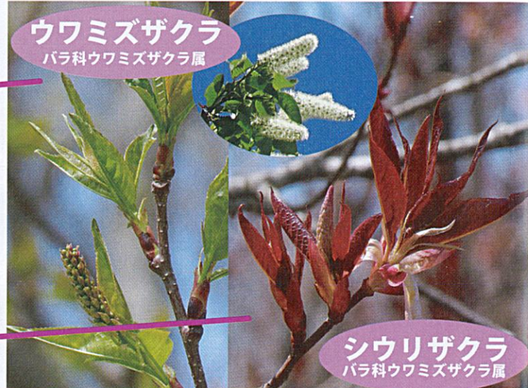
ウワミズザクラ バラ科ウワミズザクラ属