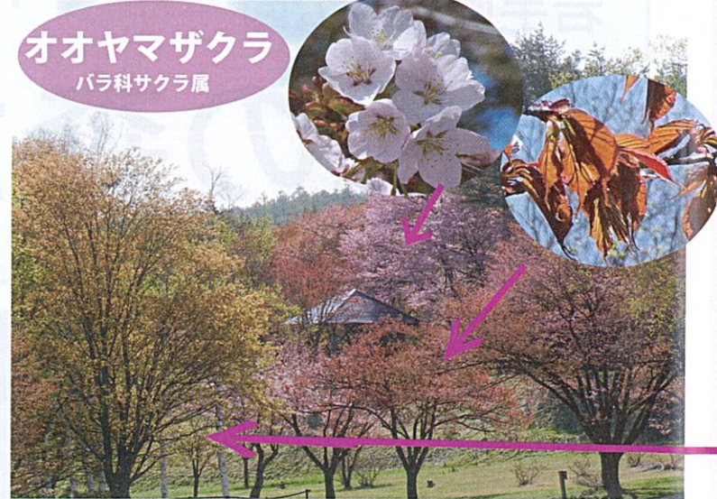
オオヤマザクラ バラ科サクラ属