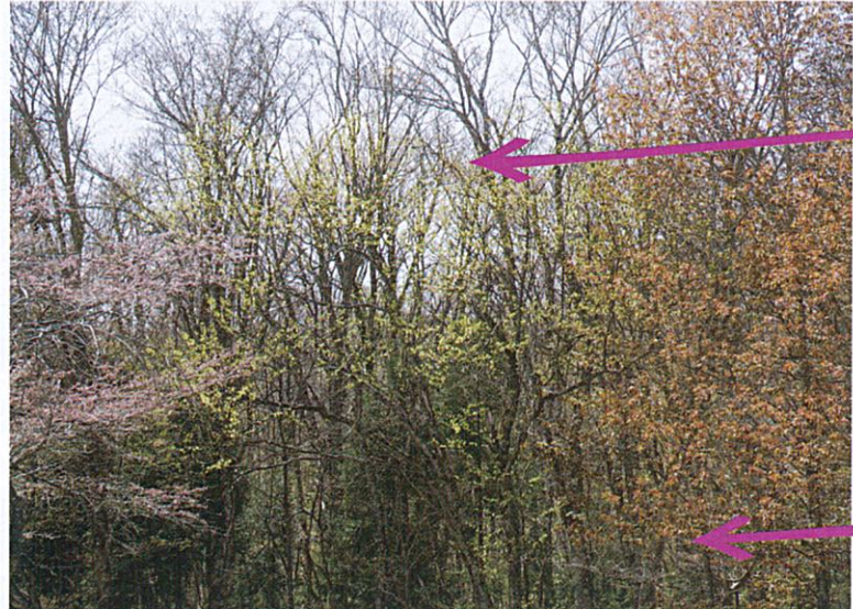
【春紅葉】2023/4/30 左のピンクはオオヤマザクラの花、真ん中は緑色のウワミズザクラの芽吹き。右はシウリザクラの赤い芽吹き。淡い優しい色合いは、まるで桃源郷にいるかのような安らかな気持ちにさせてくれます。