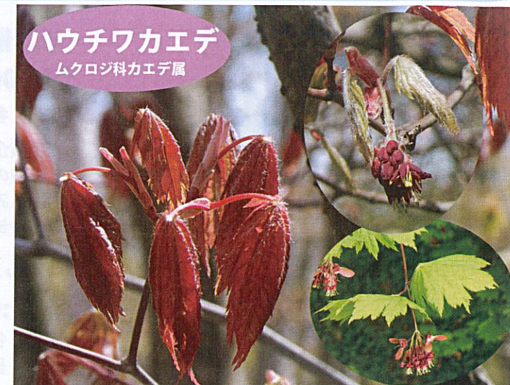
ハウチワカエデ ムクロジ科カエデ属