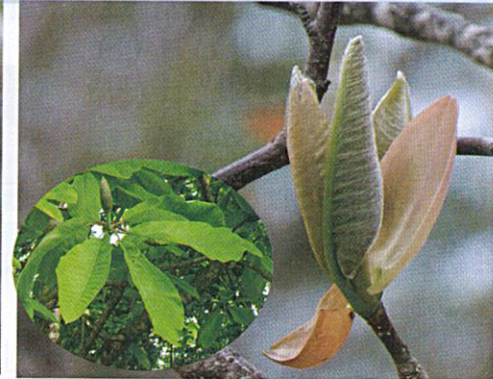
【ホオノキ芽吹き】2020/5/8 【左：新緑】2023/5/18