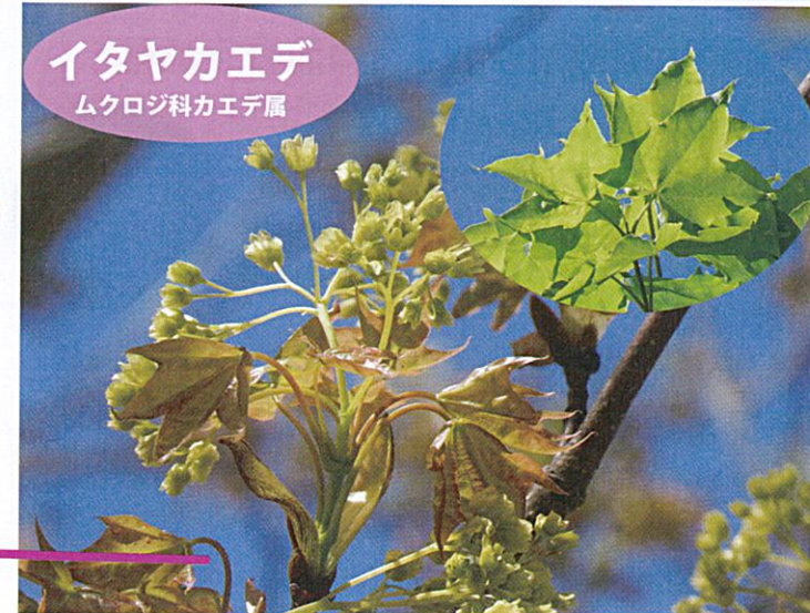
イタヤカエデ ムクロジ科カエデ属