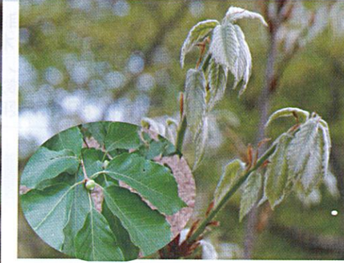
【コナラ芽吹き】2024/5/4 【左：夏の葉】2024/8/12