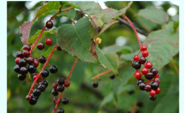
ウワミズザクラ (バラ科)