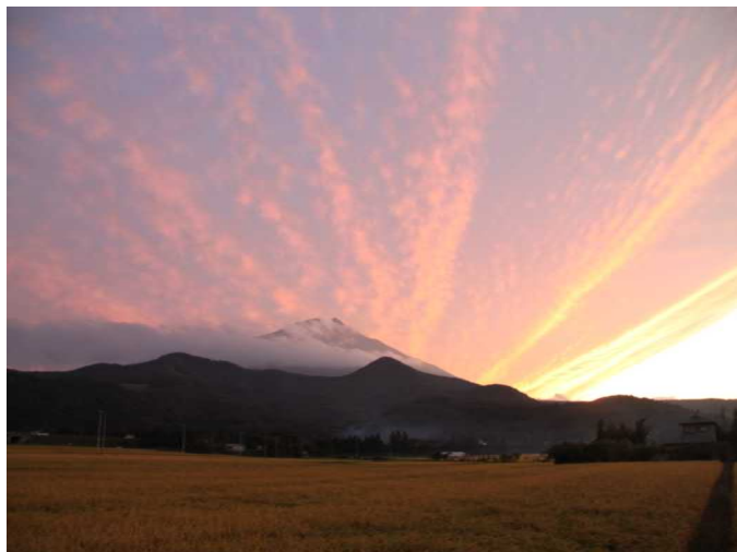
西根町から岩手山を望む