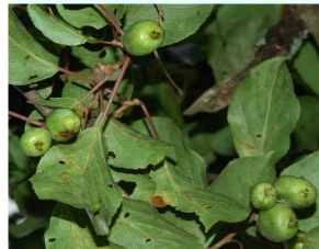
サルナシ（マタタビ科）