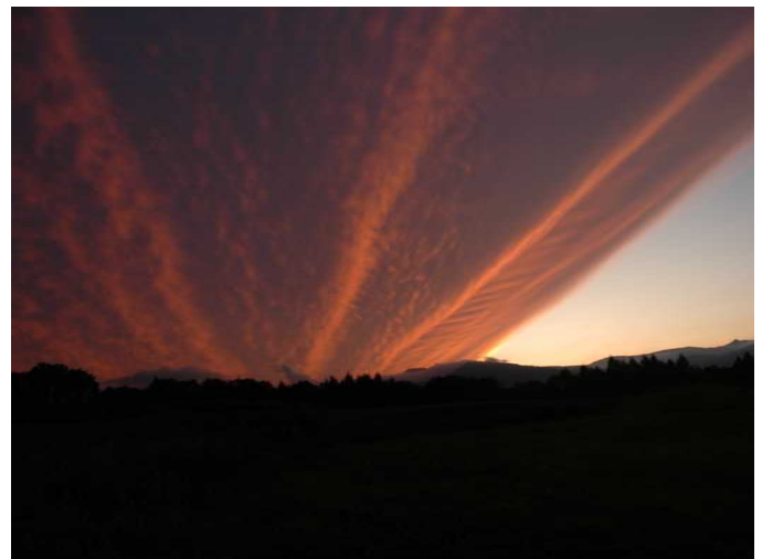
パノラマラインから西空を望む