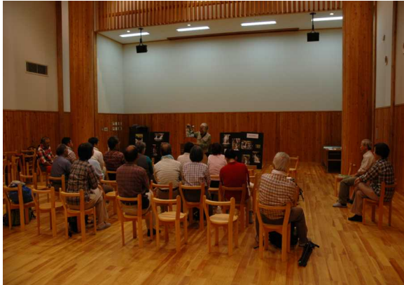
柳沢の滝・説明会

昨年開拓した焼切沢と柳沢を結ぶコース。難度が高かったため、少しコース修正をすることになりました。