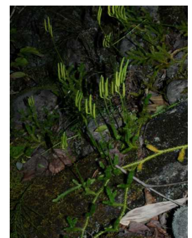
タカネスギズラ (ヒカゲノカズラ 科)