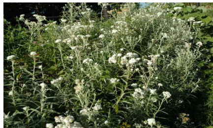
ヤマハハコ(キク科)