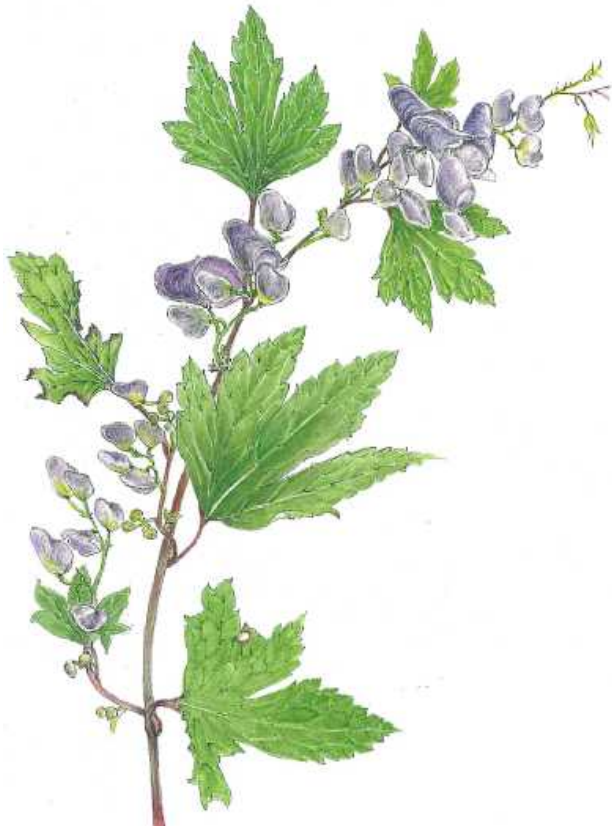
とりかぶと(きんぼうげ科)

(絵は頂きものの花で種名は不明。八幡平で見られるのは、オクトリカブトだという。)