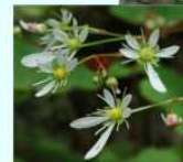
ダイヤモンドソウ (ユキノシタ科)