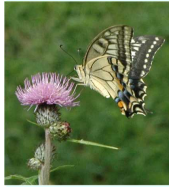
キアゲハ アケボノシュスラン (ラン科)