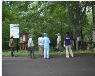
松川コース登山口