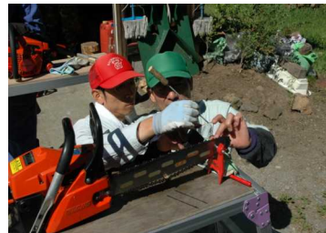
チェーンソウの目立て

初心者の手ほどきを始め、整備業務を行っている 職員の事故防止を前提とした実技の再確認です。 体験談を交えた具体的で、分かり易い内容で、