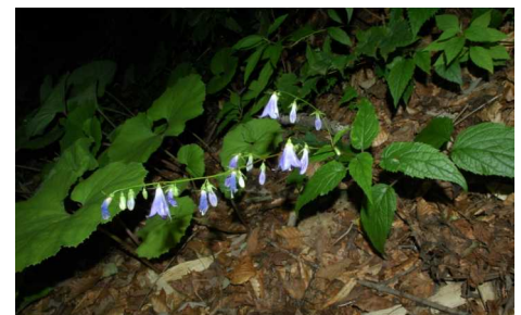
ソバナ (キキョウ科)