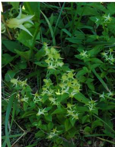
ハナイカリ(リンドウ科) マルバキンレイカ (オミナエシ科)

県民の森周辺フィールドから：県民の森周辺にも、魅力的なスポットがあるようです。足を延ばして訪ねることにしました。