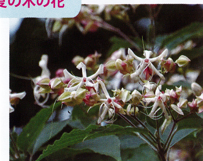
【クサギ (シソ科)】2022/9/2 蕾はピンク、咲くと白い優雅な花で、甘い香りがします。【A-2】周辺で見られます。