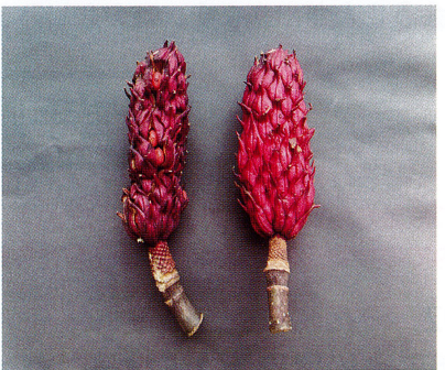
【ホオノキの落ちた実】2022/9/27 熟すと美しい紅色になり(右)、裂けてなかから朱色の種が出てきます(左)。