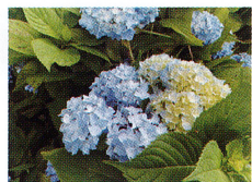
昨年、「全国植樹祭1年前記念イベント」で植樹されたアジサイ。左からジョウガサキアジサイ、カシワバアジサイ、ヒメアジサイ。