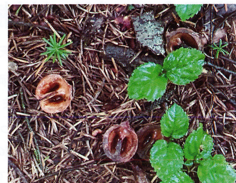
オニグルミのリスの食痕 2022/9/12