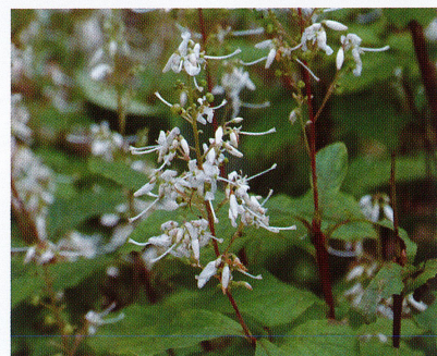
【ホツツジ (ツツジ科)】2022/8/30 白い穂状の花を多数つけます。記念の森や七滝登山道で出会えます。