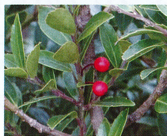
アカミノイヌツゲの実 10月29日

日本海側の多雪地帯に生える常緑低木です。雌雄異株。下部は名前のおり地を這っていて、ひっそりと林床で生活しています。冬は雪の下に埋まって過冬して、雪が融けると緑の葉をつけたまま出てくるので、芽吹き前のこの時期が一番目立ちます。7月頃に小さな可愛らしい白い花を咲かせて、秋に黒い実が出来ます。園内各所で見られる、じつは身近な木です。七滝登山道では一服峠周辺から、よく似た実が赤いアカミノイヌツゲも見られるようになります。