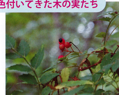
【サンショウ (ミカン科)】2022/8/30 雌雄異株。初めは緑色の実が赤く熟すと、中から黒い種が出てきます。