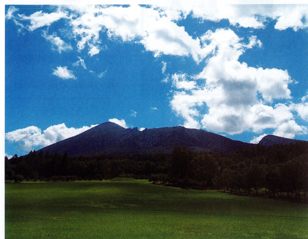
【みんなの広場から望む岩手山】2022/8/19 岩手山が濃い緑になり、青空とのコントラストが美しいです。

岩手山麓に位置する県民の森は、標高 500～1000m。里よりも涼しくて爽やかです。夏の花々や色付き始めた木の実たち、豊かな自然に暮らす生き物たちに会いにきませんか。学習館では、季節毎の園内の見どころを掲載した「フィールドマップ」を配布しております。木の実などが掲載された「秋版」も新登場。「夏版」とあわせてご利用ください。