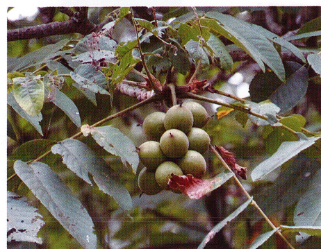
オニグルミの果実 2022/9/4

2つに割れたクルミを上下に上手に重ね、下のクルミを持って、上のクルミから食べます。