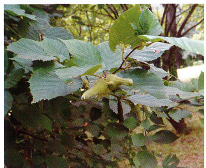
【ツノハシバミ (カバノキ科)】2022/8/6 ツノがある実は良く目立ちます。ヘーゼルナッツの仲間、美味しく食べられます。