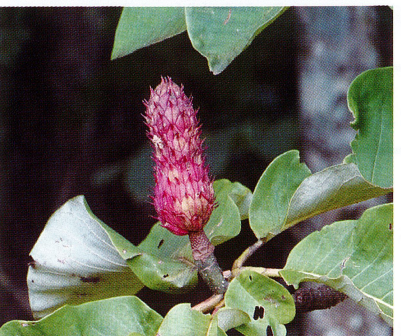
【ホオノキ (モクレン科)】2022/8/22 日本最大の葉と花と実をつける木。実も巨大で15cmほどの大きさになります。