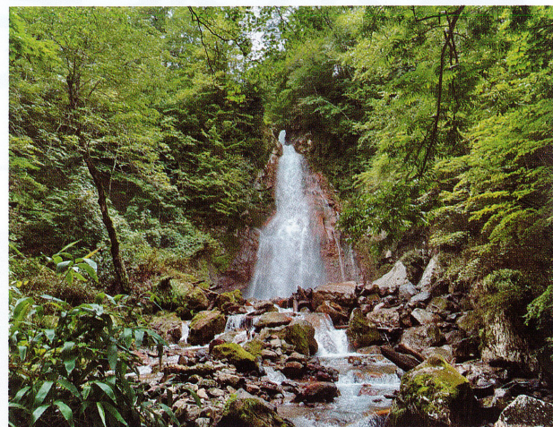
【七滝】2022/8/24 濃くなった緑のなか、清々しい滝の流れは涼やかです。