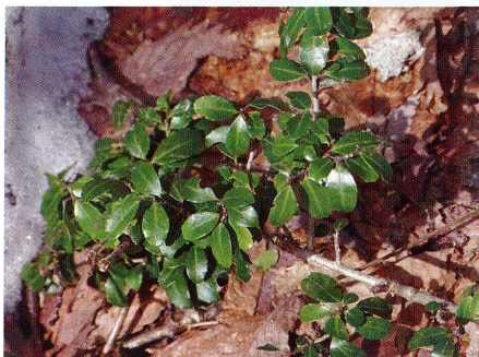
雪融けて出てきた葉 4月11日