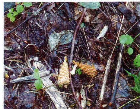
アカマツの松ぼっくりのリスの食痕 2022/9/12