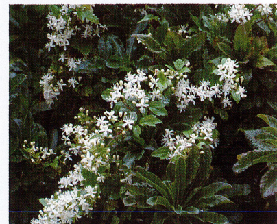
【ボタンツル (キンポウゲ科)】2022/8/10 つる性でツツジなどの上を這っています。白い華やかな花が咲きますが有毒植物です。