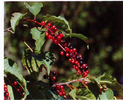
【ウワミズザクラ (バラ科)】2022/8/21 熟すと黒くなりますが、その前の彩り豊かな色合いはとても美しいです。