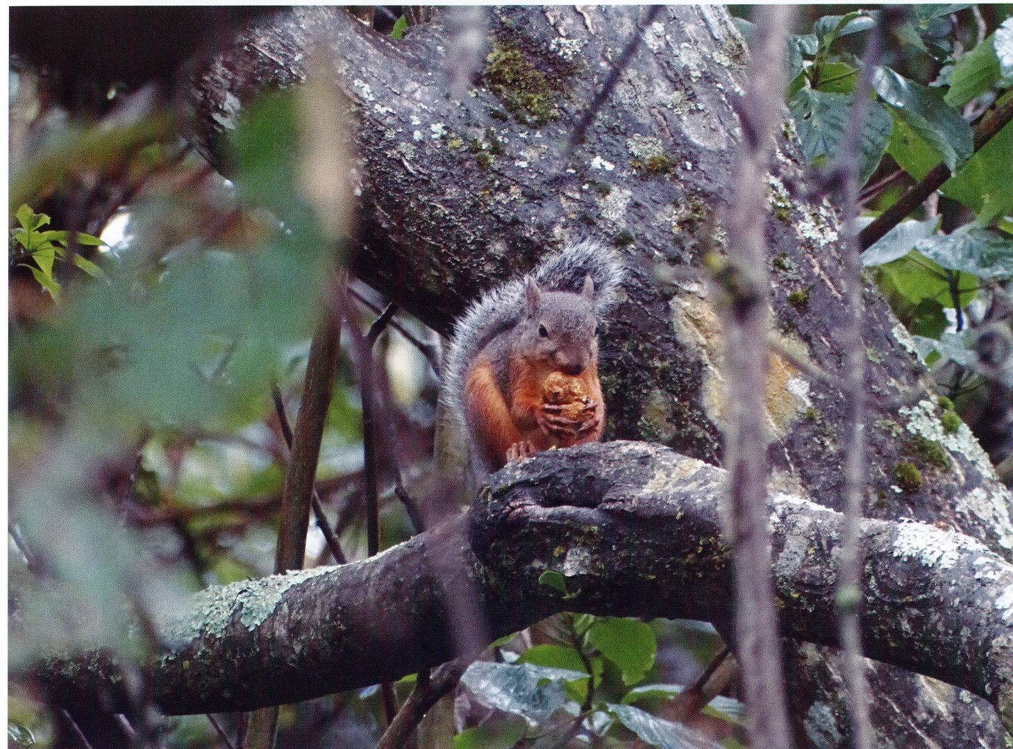
オニグルミの実を食べるニホンリス 2022年8月26日

春に咲いた花々の実が出来始めています。少しずつ色付いていく実は、毎日色合いが異なっていて、見ていて飽きることはありません。熟した実は動物や鳥たちのご馳走、気が付くと無くなっていることも多いです。運がよければ食事の動物たちの姿に出会うことが出来ます。森の楽しみを味わいに、どうぞお越しください。