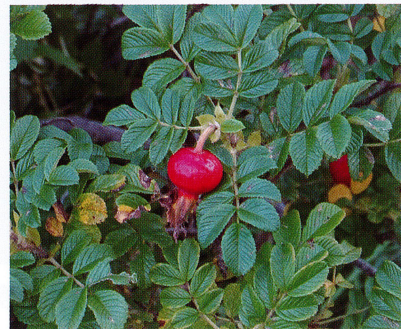
【ハマナス (バラ科)】2022/8/10 真っ赤なブチトマトのような実が出来ます。学習館前で見られます。